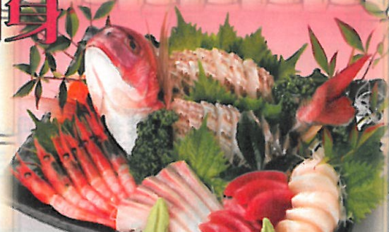
お造り盛り合わせ 6,300円